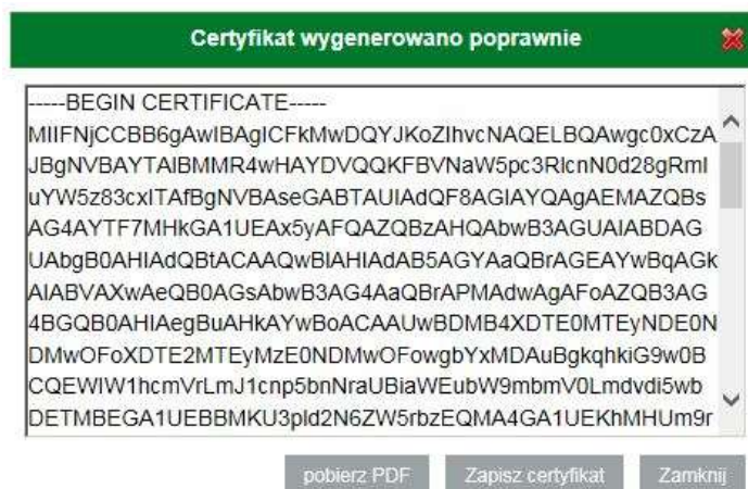
Rys. 3 Okno udostępniające wydany certyfikat oraz dokument potwierdzający wydanie